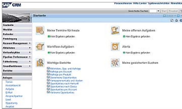
Abb.: Einfache Bedienung dank webbasierter Benutzeroberfläche