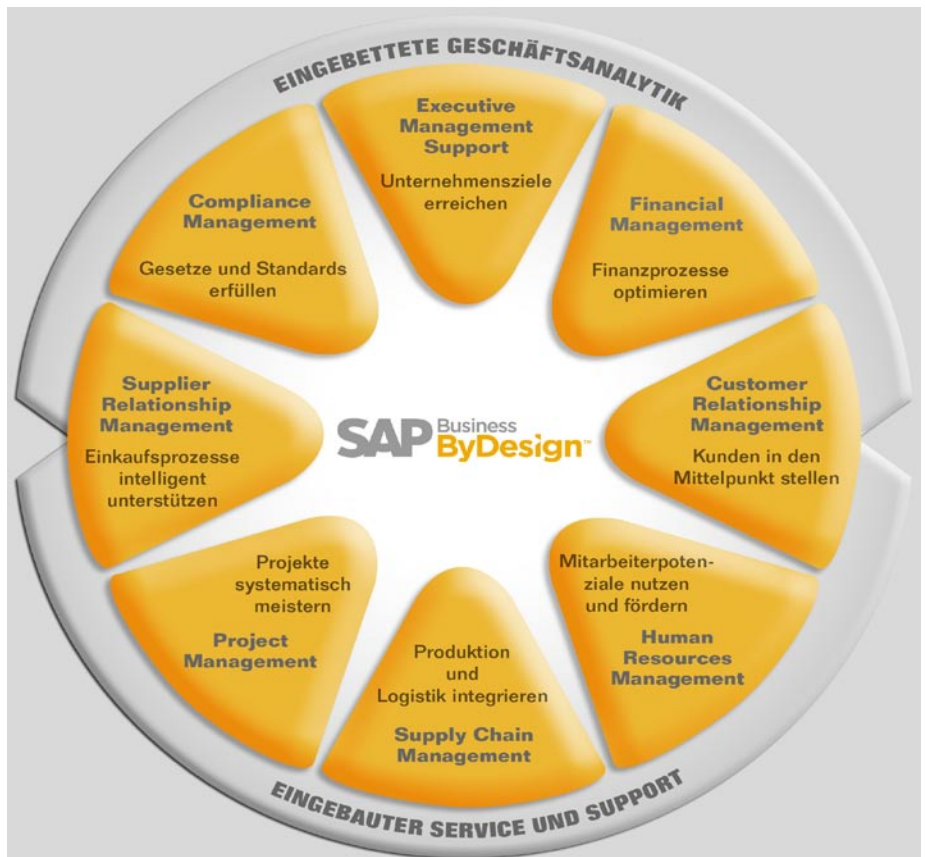
Abbildung: SAP Business ByDesign: eine umfassende und flexible On-Demand-Unternehmenslösung

SAP Business ByDesign ist eine Softwarelösung auf Mietbasis. Das heißt: Sie kümmern sich ganz um Ihr Geschäft – SAP übernimmt für Sie den Betrieb der Software. Dank einfacher Konfiguration sowie integrierter Hilfs- und Lernfunktionen sind Ihre Mitarbeiter schnell mit der Lösung vertraut – und können somit schon nach kurzer Zeit produktiv arbeiten. Umfassende IT-Erfahrung ist hierzu nicht nötig. Wenn Ihr Unternehmen weiter wächst, passen Sie die Lösung einfach den neuen Begebenheiten an – mithilfe unserer Experten. Das garantiert Ihnen langfristig maximale Verfügbarkeit und Skalierbarkeit bei minimalen IT-Kosten.